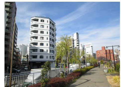
△地域のランドマークとなる外観

イエ、モノ、マチを ※東日本橋一棟ごとリノベーション! 敷地 つなぐ展 2014.6.28 (Sat) Limited OPEN! AM11:00 ~ PM6:00