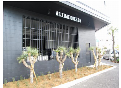
△エントランス全面には印象的な植栽

販売開始前より「イエ・モノ・マチをつなぐ展」と題した豊かな暮らし方を啓蒙するイベントを実施し、「暮らしの変化に柔軟に対応し、住みながら手を入れていく住まい方」を提案。