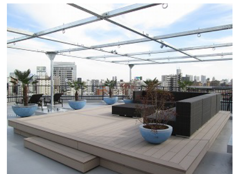
△wifi 完備のスカイリビング