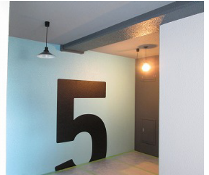
△各階ごとにデザインの異なる共用廊下の回数表示