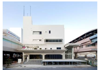
オフィス商業複合施設「TABLOID」