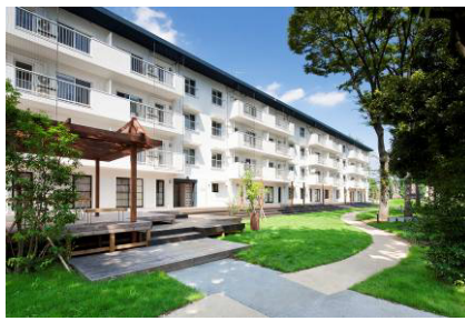
築50年のUR団地再生「りえんと多摩平」