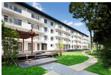
築50年のUR団地再生「りえんと多摩平」