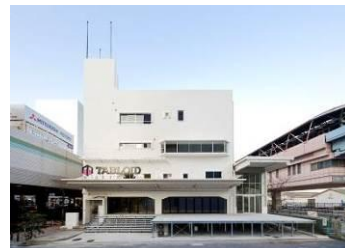
オフィス商業複合施設「TABLOID」