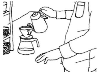
Illustration: NAIJEL GRAPH

本講座は、そんな最近のコーヒー事情に興味を持っている方や、自宅でハンドドリップを始めたという方、趣味はカフェや喫茶店巡りという方々に、いつもより一歩踏み込んでコーヒーの世界に触れていただける講座です。カップングやロースター見学を通じた豆に関する知識の習得から、様々な抽出方法の探求、さらにはコーヒー業界に関する座学まで総合的に学んでいただけます。最後はみなさんに BUKATSUDO 内のコーヒースタンドのオリジナルブレンドをプロデュースしていただくワークショップも実施予定です。