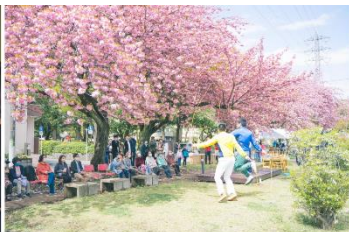
エリア一体での 多世代交流イベントの様子 (りえんと多摩平)