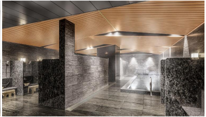
左：C棟パーティールーム完成予想 右：A棟大浴場完成予想 CG