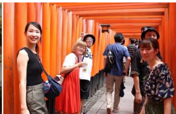
リビタのライフスタイルホテル 「THE SHARE HOTELS」への 旅行イベントの様子