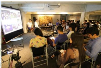
外部講師を招いての トークセッションの様子 (THE SHARE)