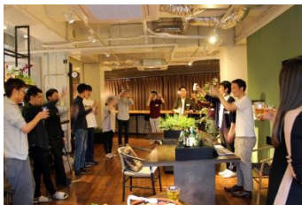
ウェルカムパーティーの様子 (シェシア恵比寿)