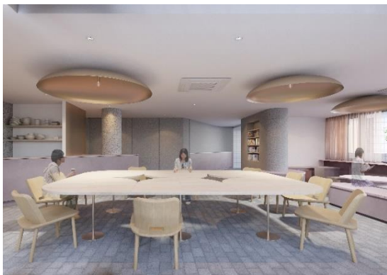
オープンラウンジイメージ