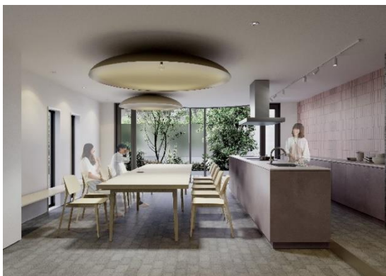
コモンキッチンイメージ