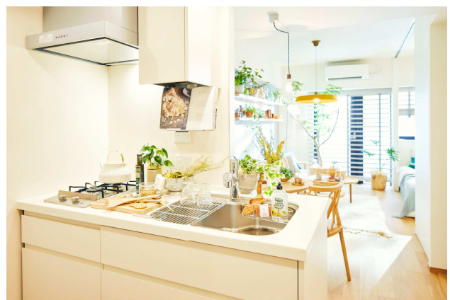
(参考)『リビオレゾン THURSDAY 調布』Fタイプ モデルルーム写真