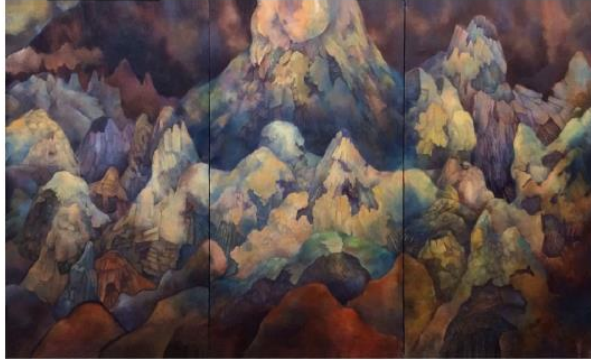
[artist] 大下 茜

略歴 1993年 北海道函館市に生まれる 2012年 函館遺愛女子高校卒業 2017年 女子美術大学芸術学部洋画専攻 卒業