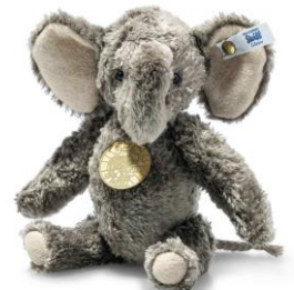
ボンボックス エレファント

商品名 : 007101 テディーズ フォー トゥモロー ボンボックス エレファント 本体価格 : 18,700円(税込) 商品特徴 : ・バンブー（竹）ビスコース ・手足はヴィオランのパッチ ・真鍮製のボタン・イン・イヤール ・5ジョイント ・詰め物はリサイクルペット素材 ・チェストタグは真鍮製