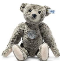
リチャード・シュタイフ テディベア