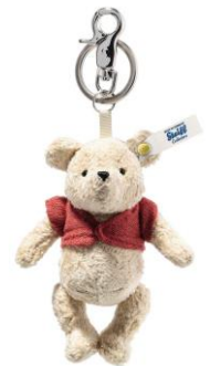
キーリング くまのプーさん

商品名 : 355905 - Pendant Disney Winnie the Pooh - キーリング くまのプーさん 本体価格 : 23,100円(税込) 商品特徴 : ・5ジョイント ・バンブービスコースベルベット ・リネン製のチョッキ ・詰め物はリサイクルペットボトル素材