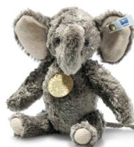
ボンボックス エレファント