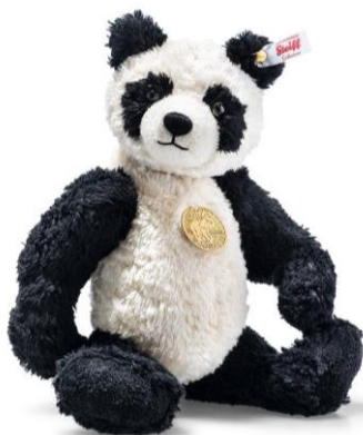
テディーズフォートゥモロー イベンダーパンダ

シュタイフ ジャパン/株式会社MS1880（所在地：東京都港区南青山、代表：西本学、以下「MS1880」）は、シュタイフ公式オンラインショップ、取扱店舗にて、 リサイクルされたペットボトル素材や自然素材を使用した「Teddies for tomorrow」（テディーズ フォー トゥモロー）シリーズの新作として、世界限定2020体の「テディーズフォートゥモロー イベンダーパンダ」を含む5作品を順次発売いたします。その発売に先駆け2022年1月21日（金）より公式オンラインショップ及び一部店舗にて予約開始します。