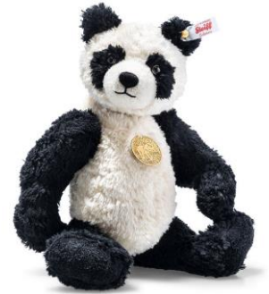
イバンダーパンダ

商品名 : 007095 - Teddies for tomorrow Evander panda - テディーズフォートゥモロー イバンダーパンダ 本体価格 : 41,800円(税込) 商品特徴 : ・世界限定 2020体 ・30 cm ・バンブー（竹）ビスコース ・5ジョイント（ジョイントは緩めとなっています） ・詰め物はリサイクルペットボトル素材、チェストタグは真鍮