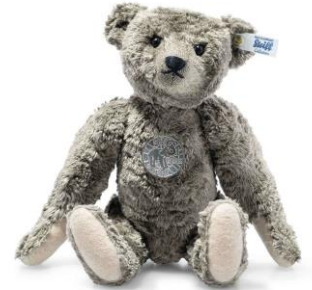
リチャード・シュタイフ テディベア

商品名 : 007125 テディーズ フォー トゥモロー リチャード・シュタイフ テディベア 本体価格 : 35,200円(税込) 商品特徴 : ・バンブー（竹）ビスコース ・手足はヴィオランのパッチ ・真鍮製のボタン・イン・イヤール ・5ジョイント ・象徴的なシュタイフ テディベアの名作たちが、 素材を置き換えて作られる新しいシリーズ（限定品ではありません） ・詰め物はポリラクチド（トゥモロコシを原料とした繊維） ・チェストタグは銅製