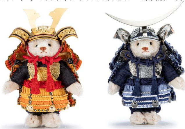
デディベア サムライ（大鍬ゴールド）

発売に先駆け、2021年11月6日（土）より公式オンラインショップ及び一部店舗にて予約販売を開始いたします。