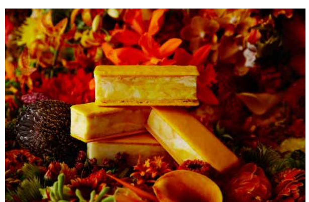
⑨ ミスグラグラ サティーヌ