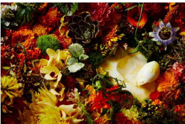
⑧ グラス サティーヌ