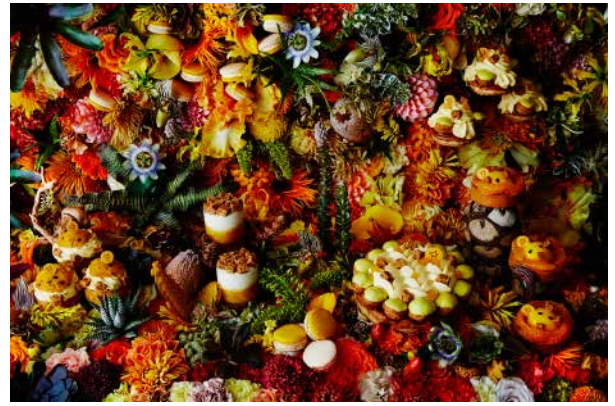
② 右から時計回りに サントノレ サティーヌ、タルト サティーヌ、マカロン サティーヌ、エモーション サティーヌ、シュー サティーヌ