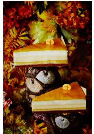
⑦ チーズケーキ サティーヌ