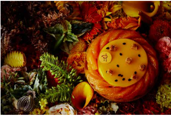
① タルト サティーヌ