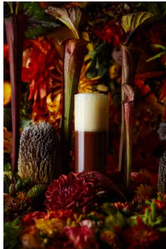
⑥ ショコラフロア サティーヌ