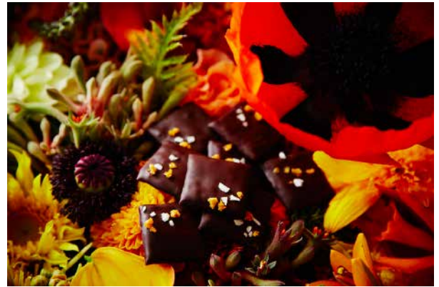
④ ヌガティーヌ サティーヌ