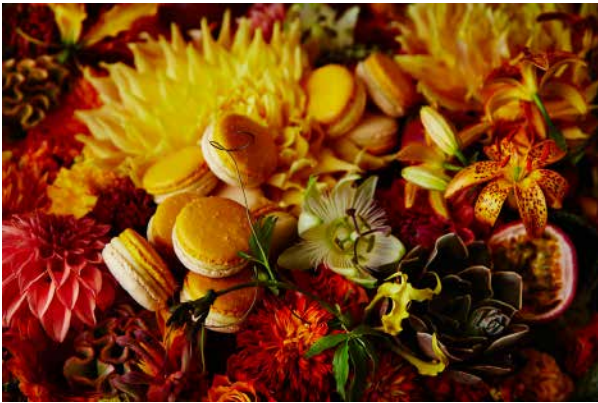
③ マカロン ヴルデー サティーヌ