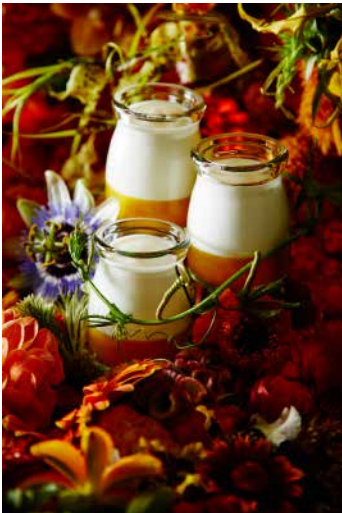
⑤ ヨーグルト サティーヌ