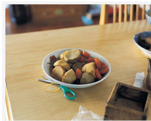
おじいちゃん、畑で採れた里芋を使って、煮物を作りました。