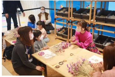
第一弾フラワーワークショップの様子