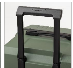
多段階キャリーバー