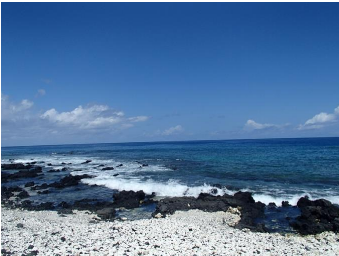
ハワイ島 ホロホロ・カイ・ビーチ