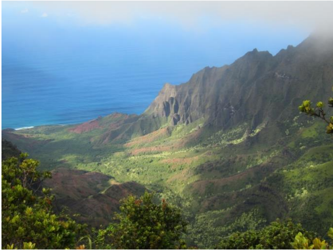
カウアイ島 ナパリコースト