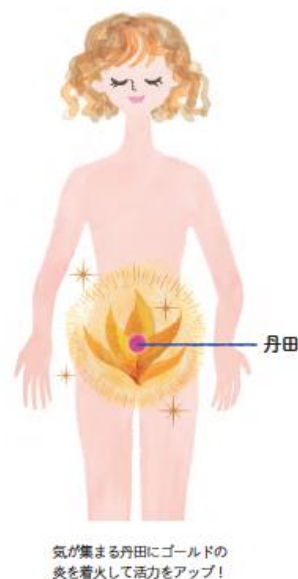
ファイヤー・クリアリングの応用編