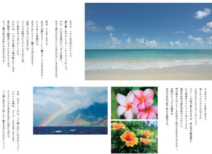
書籍内ハワイ画像