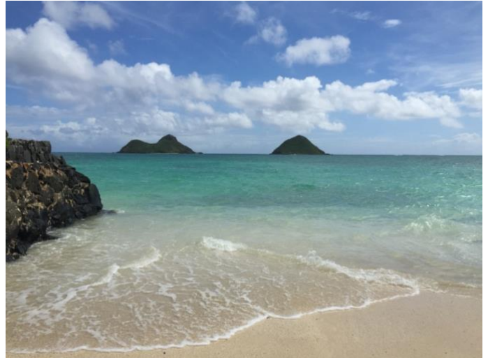
オアフ島 ラニカイビーチ