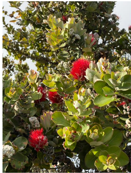
女神ペレ様の住むボルケーノにて