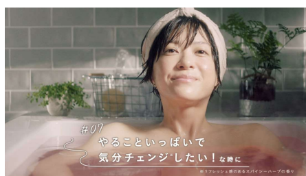
#07 やることいっぱい 気分チェンジ*したい！な時に (バブ メディキュア 発汗リフレッシュ浴) *リフレッシュ感のあるスパイシーハーブの香り