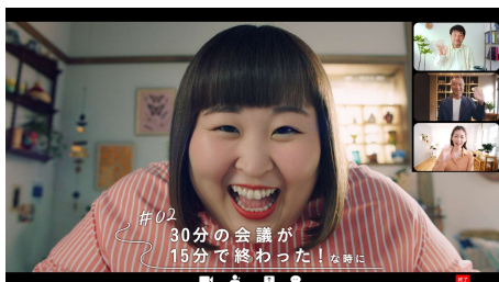
#02 30分の会議が 15分で終わった！な時に (めぐりズム 蒸気でホットアイマスク)