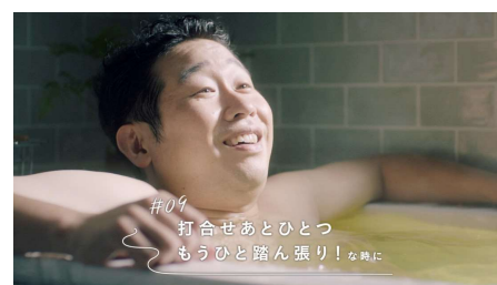
#09 打ち合わせあとひとつ もうひと踏ん張り！な時に (バブ メディキュア 爽快リカバリー)