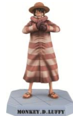
モンキー・D・ルフィ限定フィギュア 300名様