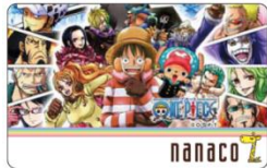
ワンピース nanacoカード 500名様