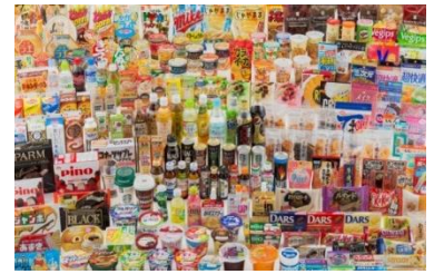
セブン-イレブンの 人気商品