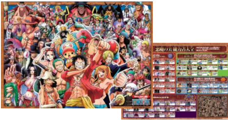
悪魔の実 能力者大集合ポスター 各店100名様