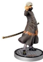
トラファルガー・ロー限定フィギュア 500名様