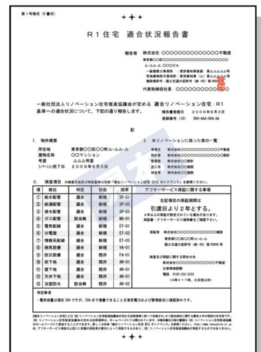
▲「R1 住宅適合状況報告書」見本

戸建て住宅に関し、内装や設備・構造部などについて基準を定めて検査。内装や設備については、R1 住宅の基準に準拠。加えて、耐震性や柱や梁などの構造部の劣化状況については、中古住宅適合証明（フラット 35）、既存住宅売買かし保険など、公的制度に適合する高い基準でチェックします。これらの検査で基準をクリアしていない項目については、リノベーションを通じて品質を確保します。