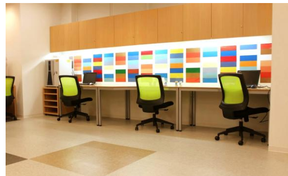
セルフサービスコーナーの様子