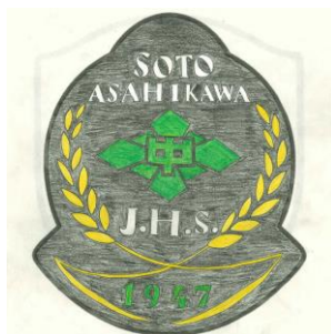
エンブレムデザイン