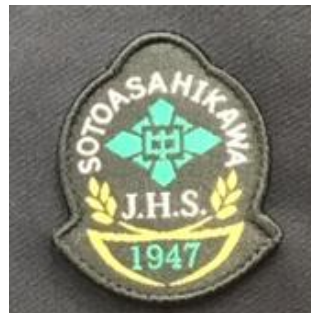
デザインを基にした実際のエンブレム