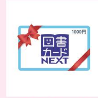
図書カード 1,000円分 + 続・親子手帳 100名様