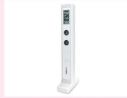
正しく測れる デジタル身長計 ヒュービディックジャパン(株) HUK-2 + 続・親子手帳 10名様