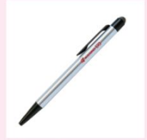
タッチペン付き ボールペン + 続・親子手帳 370名様