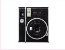
インスタントカメラ “チェキ” FUJIFILM instax mini 40™ + 続・親子手帳 10名様