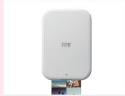
スマホ専用 ミニフォトプリンター キヤノンマーケティングジャパン(株) iNSPiC PV-233 + 続・親子手帳 10名様