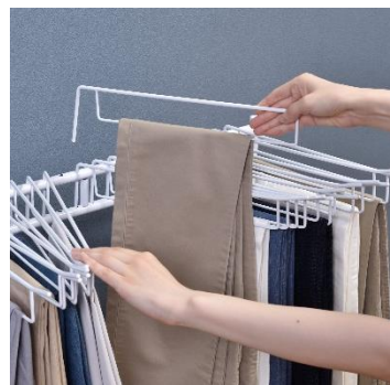
スイング式で使いやすいハンガー