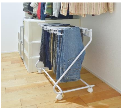
クローゼット下のスペースにぴったり

スーツのパンツや、普段着るデニムパンツやチノパンなど、男女問わずパンツスタイルが定着した昨今、チェストなどの引き出しに重ねて収納すると、着たいものがすぐに見つからず大変。そんな時に便利なのが、ビーワーススタイルのスラックスハンガー。2022年にはハウスキーピング協会主催の、整理収納アドバイザーの方々審査をする「シンプルスタイル大賞」で特別賞を受賞。「スラックスハンガー」は、パンツなどを掛けて収納できるため、探しやすく取り出しやすい。クローゼット下にぴったり収まり、収納スペースを有効活用できるため、整理収納アドバイザーをはじめ、SNSでも注目を集めています。これからの大掃除シーズンに向けて、クローゼット収納を見直してみませんか？