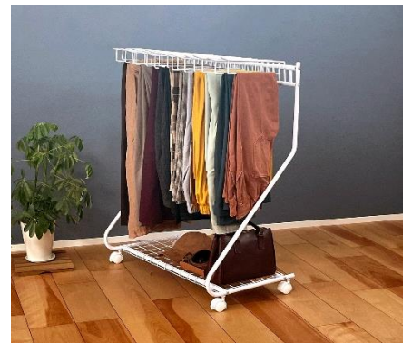
<ハイトタイプ 20本掛け 網棚付き>