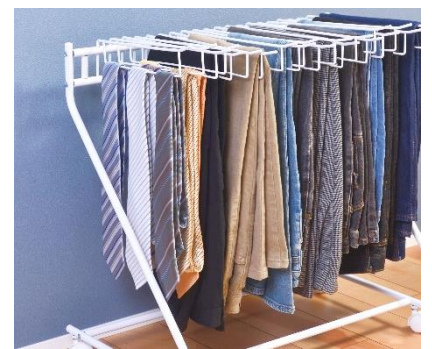
ネクタイやマフラーなども