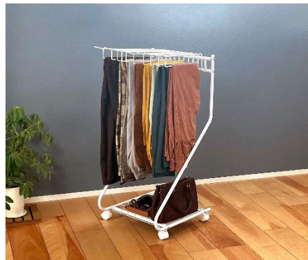
<ハイトタイプ 10本掛け 網棚付き>