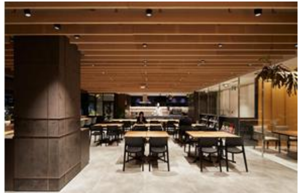
▲3階 シェアダイニング / 4階 コワーキングスペース、ファクトリーキッチン