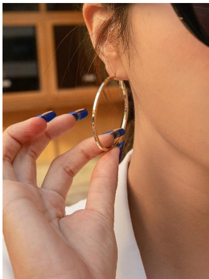
商品名 : DAZY ミニマリスト フープピアス 価格 : ¥120 コード : SKU: sj2205110452483948