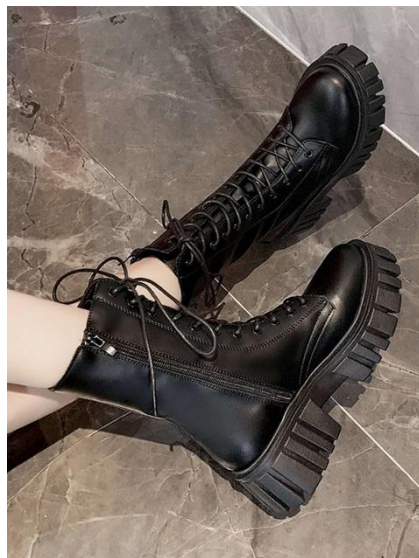
商品名 : レースアップサイドジップ プラットフォームブーツ 価格 : ¥3,868 コード : sw2107318838787996