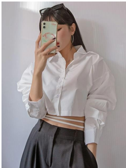
商品名 : DAZY ドロップショルダー ボタンフロント クロップシャツ 価格 : ¥1,565 コード : sw21111231363354318