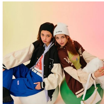
【NET ViVi 2022年9月掲載】