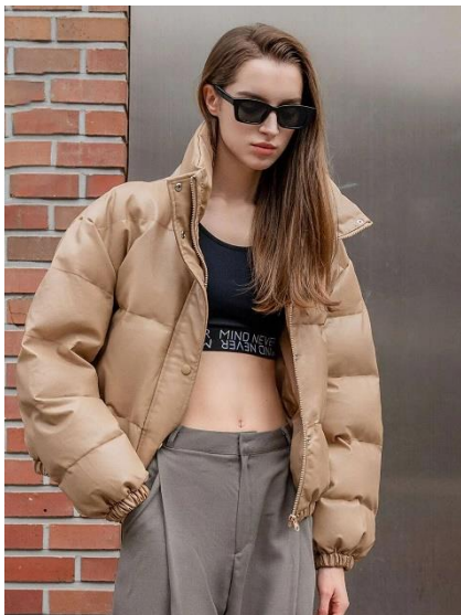
商品名 : SHEIN COLDBREAK パッチ フロント ハイネック パッファーコート 価格 : ¥3,979 コード : swouter30210524547