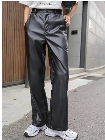
商品名 : DAZY パンツ ハイウエスト スラントポケット PULゼー 価格 : ¥2,481 コード : sw2108266664919111