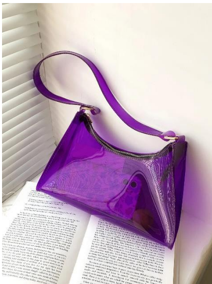
商品名 : クリアバゲットバッグ 価格 : ¥495 コード : sw2107247371186756