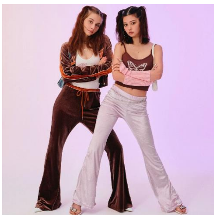
【NET ViVi 2022年9月掲載】