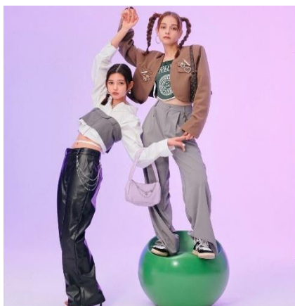
【NET ViVi 2022年9月掲載】