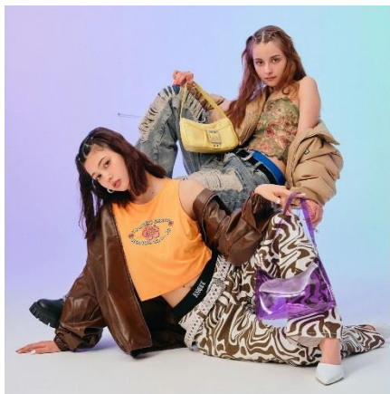
【NET ViVi 2022年9月掲載 / Photo:MELON(TRON)】