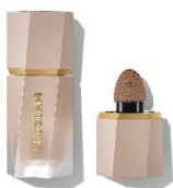
Soft Tan ※