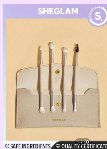
SHEGLAM Glam 101 アイエッセンシャルブラシセット バッグ付き