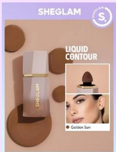
SHEGLAM サンскарプト リキッドコントゥア - Golden Sun

『SHEGLAM』は、アイメイク、リップ、チーク、ベースメイク、アイライナー、ネイル、つけまつげ、メイクブラシ、メイク道具、メイクボックス、ヴィック&アクセサリ、ヘアケア、スキンケア、ボディケア、タトゥーなど15種類以上のカテゴリーに渡るメイクアップアイテムを展開しています。メイクアップに必須なレギュラーアイテムはもちろん、クレンザーやつけまつげなどのビューティーツールも充実しており、メイクアップの全てが揃うワンストップショップです。