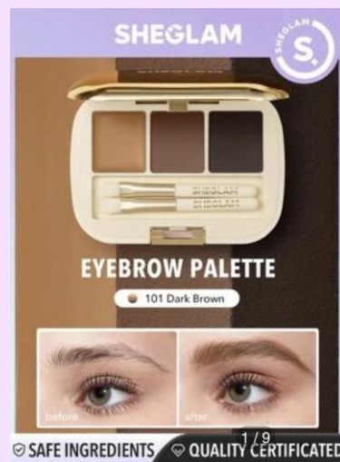
SHEGLAM Expert アイブロウパレット 101 ダークブラウン