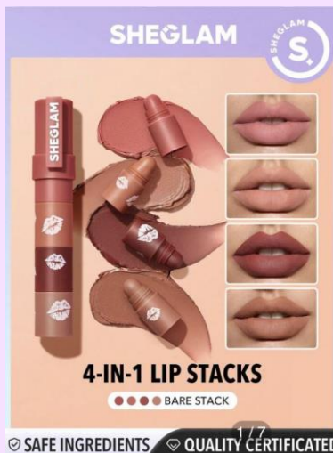
SHEGLAM メガリップスタック Bare Stack