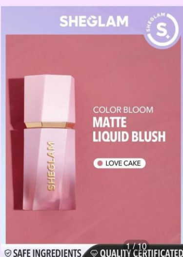
SHEGLAM Color Bloom リキッドチーク Love Cake