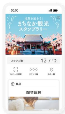
スタンプラリー/ スタンプカード