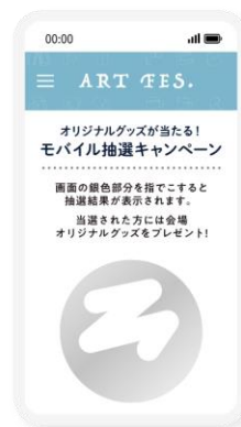
モバイル抽選 システム