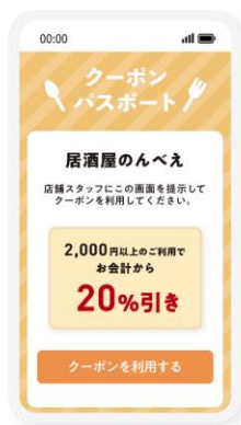
クーポン提供 システム