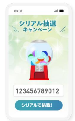
シリアルナンバー 抽選システム