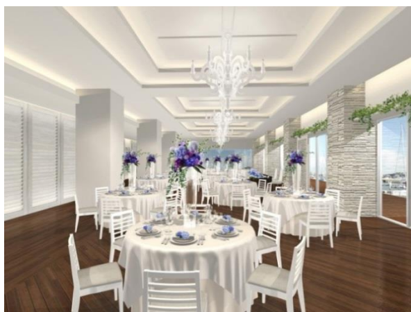
(1Fバンケット完成予想図)