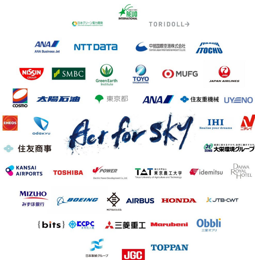
図1. Act For Sky

木村化工機株式会社（以下「当社」）は、2024年12月2日（月）に羽田空港のTIAT SKY HALLで初開催される「ACT FOR SKYシンポジウム」において、「SAF ※1 用バイオエタノールの自給に向けた新プロセス構築について」と題した講演を行い、国産バイオエタノールを製造する上での3つの課題と解決策について説明します。当社が提案する解決策の1つは、発酵直後のアルコール濃度が低いエタノールを蒸留する際に、エネルギー消費量の大きいボイラ蒸気を使わず、当社が発明した、低消費電力で蒸留する「ヒートポンプ式バイオエタノール蒸留装置」を活用することです。これにより蒸留プロセスのCO 2 排出量をゼロにすることも可能です。当社は令和6年4月に国産SAFの商用化と普及拡大に取り組む有志団体「ACT FOR SKY ※2 」に加盟しております。