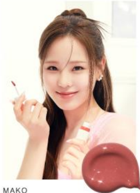
MAKO 11 SUNSET SERENADE