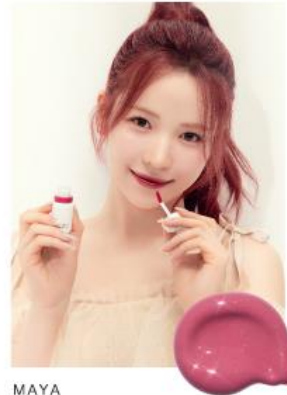
MAYA 06 REAL RASPBERRY