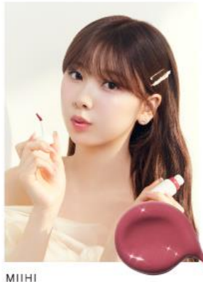
MIHI 09 ROSY AFTERNOON