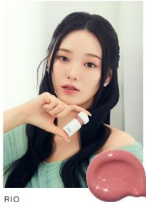
RIO 02 WHISPER NUDE