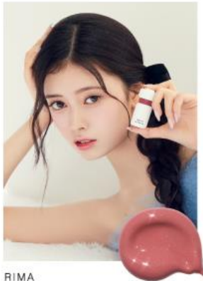
RIMA 10 ATELIER FIG