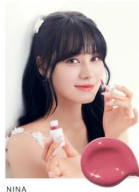
NINA 08 SUNDAY PINK