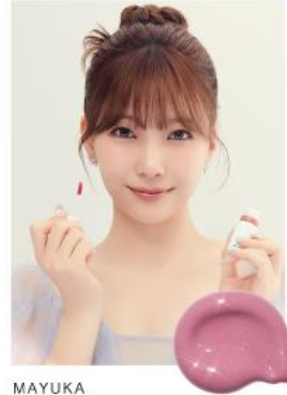
MAYUKA 07 BABY PEONY