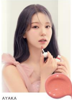
AYAKA 03 MERRY MAGNOLIA