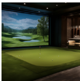
シミュレーションGOLF ラウンジ

また、サービス開始を記念して、2025年2月25日までに登録いただいた方の中から、抽選で100名様にアマゾンギフト券1,000円分をプレゼントいたします。（毎月抽選で10名様）