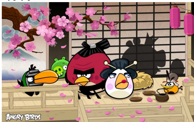
日本をテーマにした新エピソードのイメージ

フジテレビとRovioは、今後もそれぞれのノウハウを最大限に活用し、新たなエンタテインメント体験を日本のユーザーにお届けするべく協議を重ねてまいります。