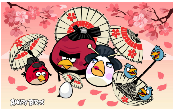
日本をテーマした新しいエピソードのイメージ