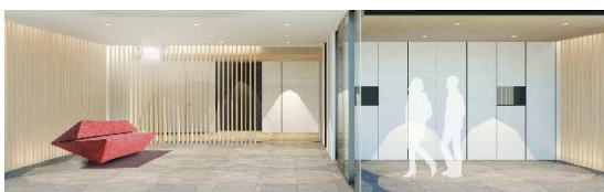
上:ルフォンプログレ森下四丁目、下:(仮称)門前仲町Ⅱ計画