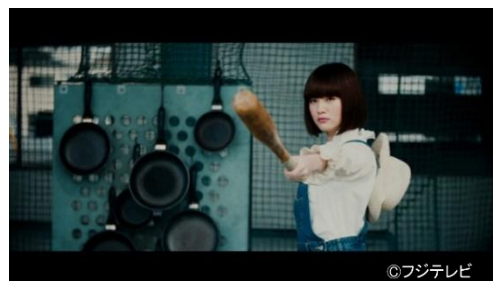
「ワールド タマゴボール クラシック」

フリーランスの映像ディレクターとして活動。CM/VP/MV/TV 短編ドラマなど幅広いジャンルで活躍。近年の監督作に、小学生あるあるを描いた「KIRIN プラズマ乳酸菌」WEBCM、在日ファンク「ぼいぼい」MV、満島ひかり主演ドラマ「人間椅子」など http://shuheishibue.com