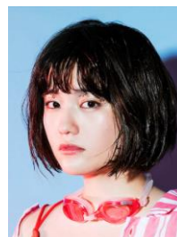
MICO (SHE IS SUMMER)