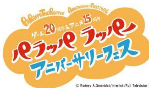
「ゲーム 20 周年 & アニメ 15 周年 パラッパラッパー アニバーサリーフェス」会場イメージ図