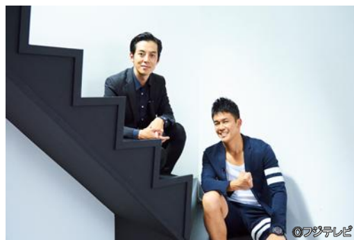
(左から)西野亮廣、武井壮