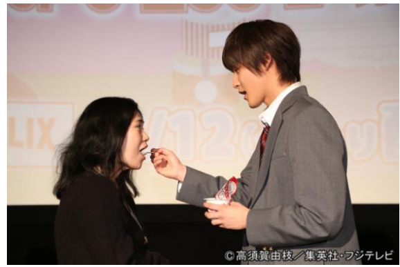
白石隼也が来場者へサプライズプレゼント

フジテレビは、地上波で培ってきた制作力を活かし、フジテレビ発のコンテンツを Netflix などの動画配信プラットフォームへ積極的に供給することで、ドラマやアニメを始めとする日本の映像を世界へ向け発信し、日本のカルチャーを世界中の方々へ提供してまいります。