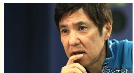
関根勤 番組内画像