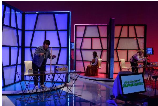
回転台からチームで様々なゲームにチャレンジ

4人はゲームを始める前に順番を決め、ターンテーブルに座り、ステージ毎に決められた時間が経つと自動的にターンテーブルが回転。強制的に次の人へバトンタッチされます。ターンテーブルが回転し、それまで仲間が築いてできたものを初めて見ることに…そこから自分の制限時間内で精一杯チャレンジし、相手チームより高得点を狙います。そして、勝利したチームが賞金を目指して、超難解ゲームに挑みます。勝つも、負けるも、全ては4人のチームワーク次第！果たして、どこまで回転するターンテーブルで、繋げられるのか…『ツナゲー』スタートです！