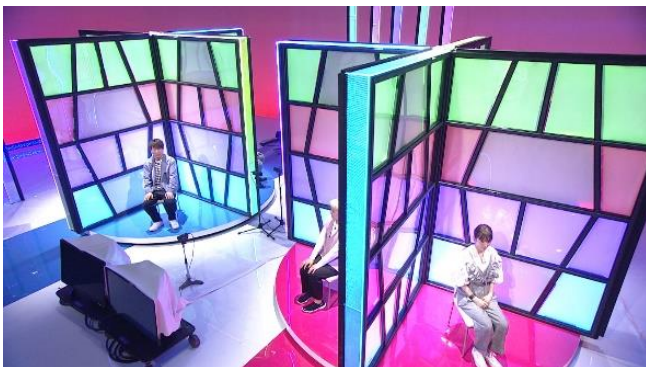
解答者が乗る、回転ターンテーブル！