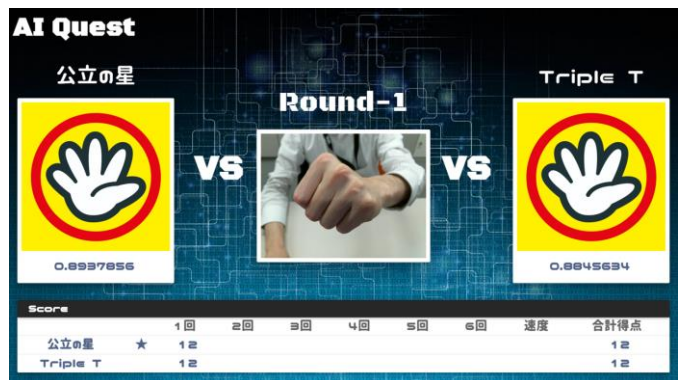
<大会競技イメージ画像>