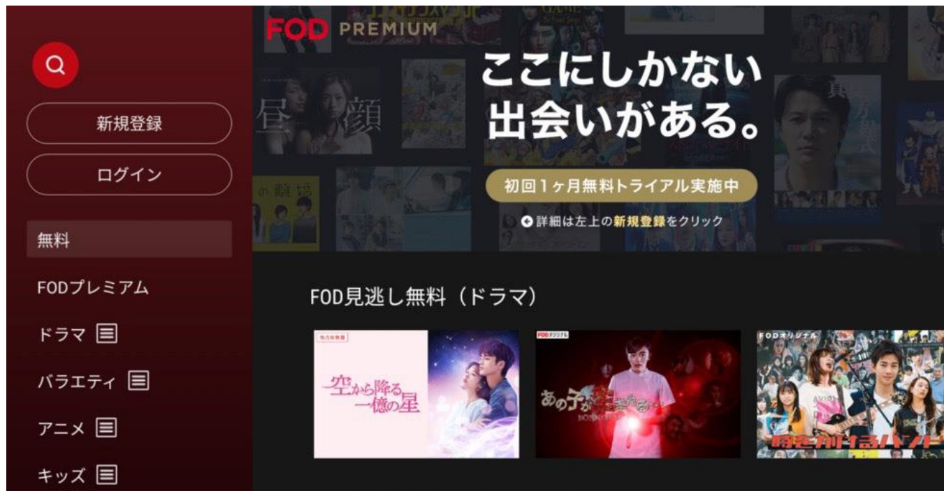
テレビアプリ「FOD」イメージ画像

フジテレビは、フジテレビが運営する動画配信サービス FOD にて提供しているテレビアプリ「FOD」が、累計ダウンロード数 300 万件を突破したことをお知らせします。