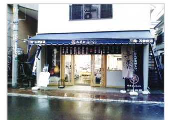
丸平かつおぶし梅屋敷店(震災前)