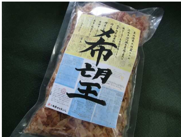
「希望」という文字は丸平かつおぶし会長の御孫さん(中学生)直筆 「復興への希望」を込めて…

また、同日7月1日(金)より、『お台場めざまマルシェ』ホームページ上での販売を開始いたします。