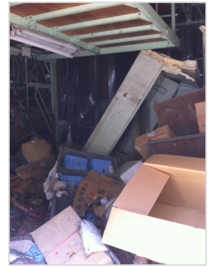
震災後の漬け魚工場

『株式会社 丸平かつおぶし』は、創業明治 36 年以来、こだわりのかつおぶしや三陸の豊富な海の幸を利用した「漬け魚」などの製造・販売を行ってきました。東北 6 県の 1000 店舗を超えるうどん屋さん、蕎麦屋さんでも使われ続けています。また、2008 年には、念願の東京の直売店を大田区梅屋敷にオープンいたしました。しかし、東日本大震災により、甚大な被害を受け、本社工場は水没し、食材の供給が出来ないため、本店の営業はもちろん、3 年半続けてきた梅屋敷店を閉めざるを得ない状況に追いやられたのです。 ただ、唯一の大きな希望が残されていました。創業以来ずっとこだわって作ってきた「かつおぶし」の工場だけは、本社 3 階にあったため無事でした。 さらに、閉店した梅屋敷店に貼り出した「閉店のご挨拶」の紙には、たくさんのお客様からの応援のメッセージが、ぎっしりと寄せ書きされていたのです。 『株式会社丸平かつおぶし』は、原点に戻り、応援して下さいったお客様に「恩返し」をするために、「希望のかつおぶし」で復興を目指します。