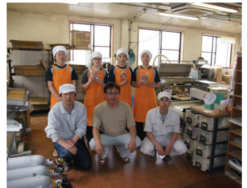
「丸平かつおぶし」工場のみなさん