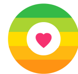
めざましフードエイド

現在、「めざましテレビ」が展開している東日本大地震により被災された方を応援するプロジェクト「めざましエイド」の一環として、『お台場めざましエ』にて、「めざましフードエイド」を展開しております。 2011年5月20日(金)～21日(土)に開催した企画第一弾では、『宮城県石巻市の「希望の缶詰」』を取り上げました。 岩手県、宮城県、福島県の物産を通常よりも数多く取り揃え、今後も復興支援に繋がるような取り組みを行ってまいります。