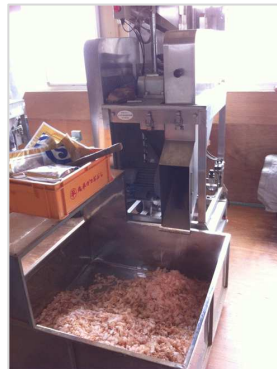
削りぶしを作る様子