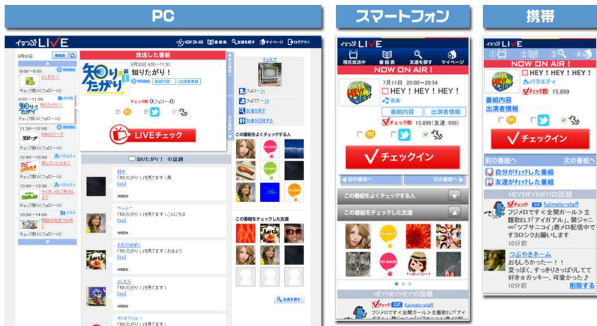
『イマつぶ LIVE』サイトイメージ

フジテレビは、2010年4月より提供しているミニブログサービス『イマつぶ』に2011年8月31日(水)よりオープンしたソーシャルチェックインサービス『イマつぶ LIVE』を、2011年9月29日(木)より、株式会社ミクシィが提供する「mixi ページ」にて展開を開始いたします。