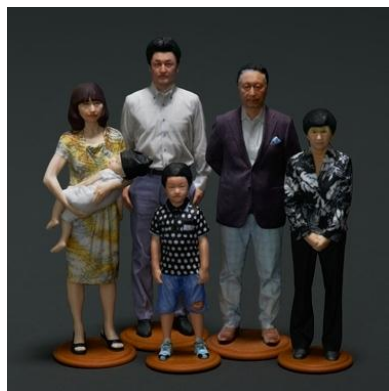
hollyhook 「1/10 JIBUNギフト券」 一体108,000円

大切な家族の記念日に、とっておきの家族写真を。話題の3Dプリンターで、「1/10サイズのフィギュア」を作ることができるギフト券です。今この瞬間の家族の姿カタチを、驚くほどリアルに再現。撮る時間も家族のいい思い出になる、どこに飾ろうかとワクワクする、みらいの家族写真です。