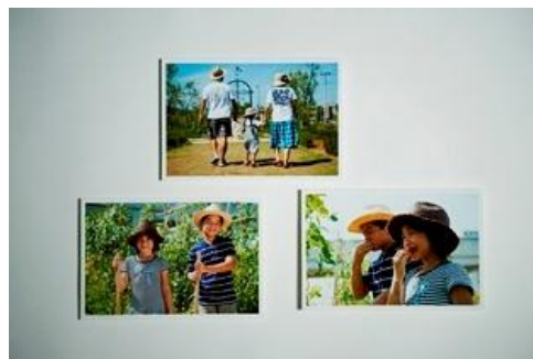
オークビレッジ 柏の葉 「体験型貸し農園ギフト券」 246, 240円

キzzaニアを運営するKCJ GROUPの体験型貸し農園「オークビレッジ 柏の葉」で、農園の年間利用体験ができるギフト券です。農具の貸し出しがあり、シャワールームも完備、普段のお手入れは農園スタッフが行います。休みの日に家族で土に触れ、熟した野菜を持ち帰って食べる、お子さまの食育にもなる初登場の新しいギフトです。