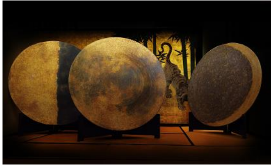
＜裕人礫翔＞月光礼賛 Moon Light Magic 和紙・金箔・銀箔、3点セット、各直径130cm

確かな技術と高い信頼から、建仁寺にて観覧されている「風神雷神図屏風」などの金箔修復に携わる金箔工芸師・裕人礫翔氏。モダンアートへの造詣も深く、金銀模様箔の伝統技術を受けつぎ、コンテンポラリーな表現に昇華しています。