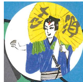
三越銀座店 アーティスト:峰岸達 キャラクター:歌舞伎