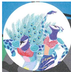
伊勢丹新宿本店 アーティスト:牛木匠憲 キャラクター:2羽の孔雀