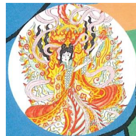
三越日本橋本店 アーティスト:若林夏 キャラクター: 天女(まごころ)像