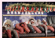
石見神楽温泉津舞子連中