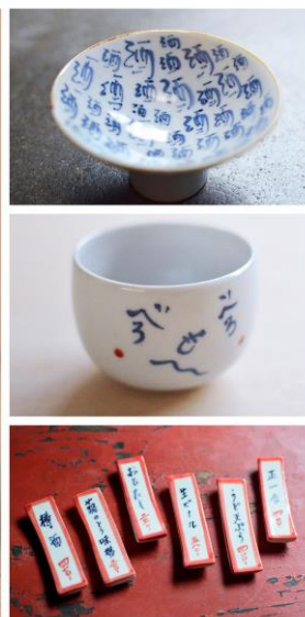
※展示作品のイメージ

全国約1,700の酒類(日本酒、本格焼酎・泡盛、本みりん)メーカーが所属する日本酒業界最大の団体である日本酒造組合中央会(以下、中央会)は、國酒の魅力に直接触れて知ることができる「日本の酒情報館(以下、情報館)」を企画・運営。日本酒の魅力やトレンドをより多くの方に知っていただこうと、随時、情報発信をしています。