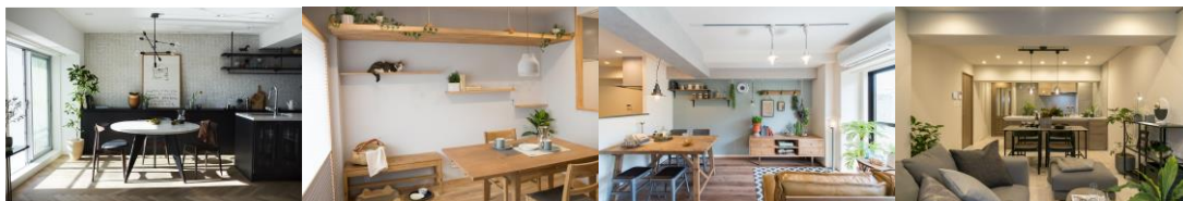
▲RE:Apartment UNITED ARROWS LTD. ▲マイリノペット