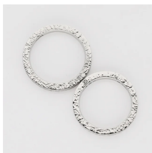
サージカルステンレス