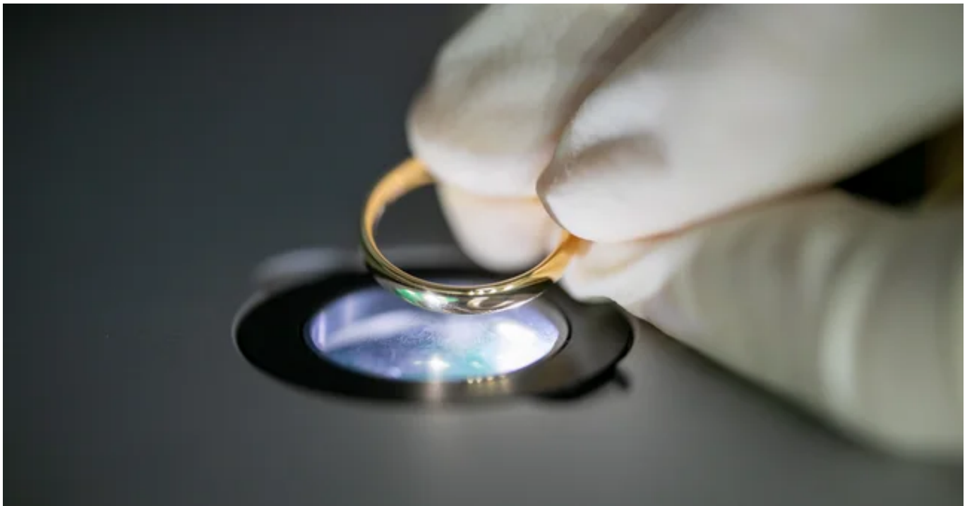
蛍光X線分析装置で指輪の組成を測定

金属アレルギー対応素材の成分を全数検査とし、品質においても金属アレルギーをもつカスタマーをサポート。