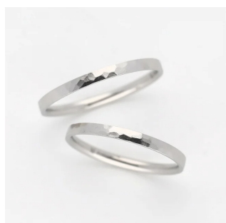
プラチナ×イリジウム

これまでも、一部の貴金属地金に関しては外部機関にて品位検査を行っておりましたが、今後は自社内において検査が可能となります。特に金属アレルギーをお持ちの方にとって重要となる金属アレルギー対応素材の検査は自社にて全数検査を行う為、金属アレルギーの方でも素材に対して安心してご購入いただけます。