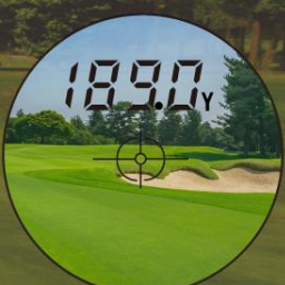
【バンカー超・手前まで】