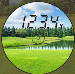
【池超え・手前まで】